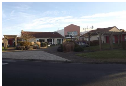
EHPAD les Grillons