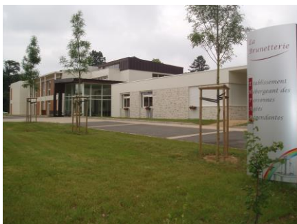
EHPAD la Brunetterie